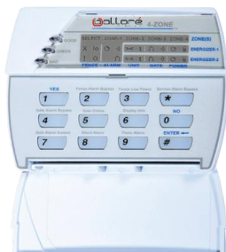
Clavier de commandes