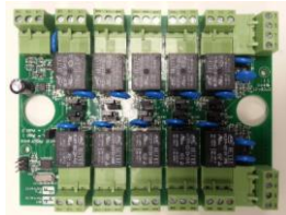
Carte extension E/S